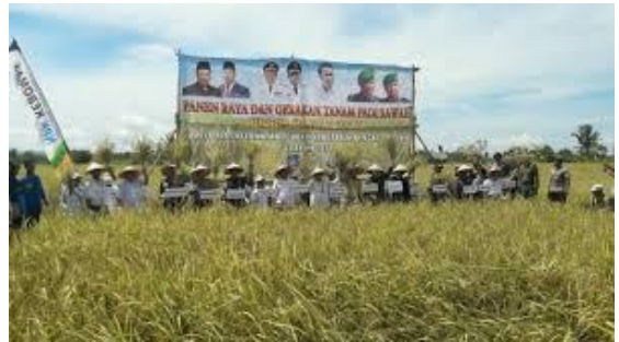
Gerakan Tanam Padi di Bangka Selatan