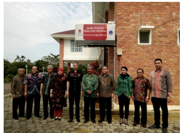
Galeri Investasi Bekerja Sama Dengan BEI