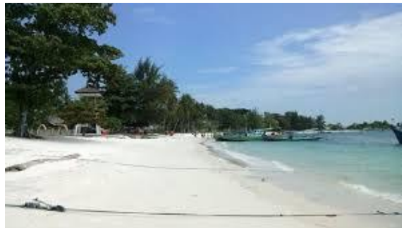
Salah satu Pantai di Bangka Belitung